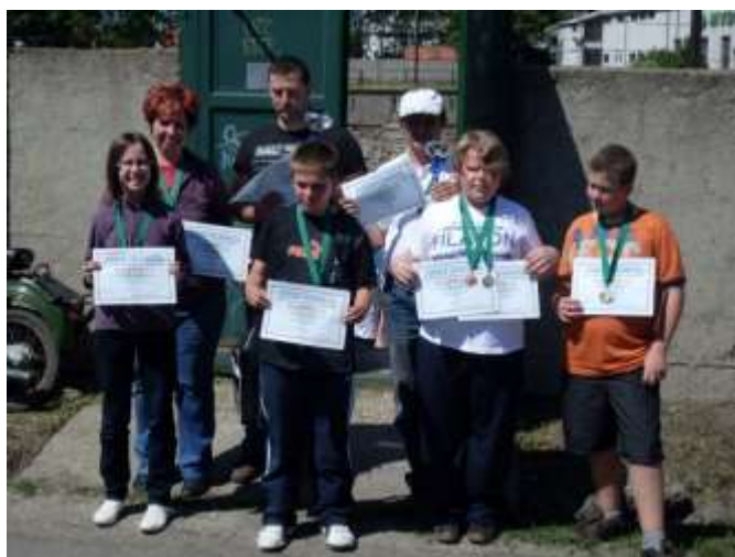
6. sz. kép

A felnőtt csapat tagjai egyénileg kiemelkedőt senki nem lőtt, de mint csapat jól szerepeltek. A puskás Csapat kupát elnyerték, pisztolyban harmadik helyen végeztek, s az összesített pontverseny második helyét is megszerezték.