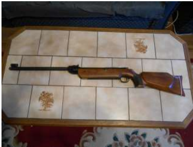
Diana Mod 60 légpuska

A klubban használt fegyverek jelentős részben a versenyzők tulajdonában vannak, néhány van a klub tulajdonában.