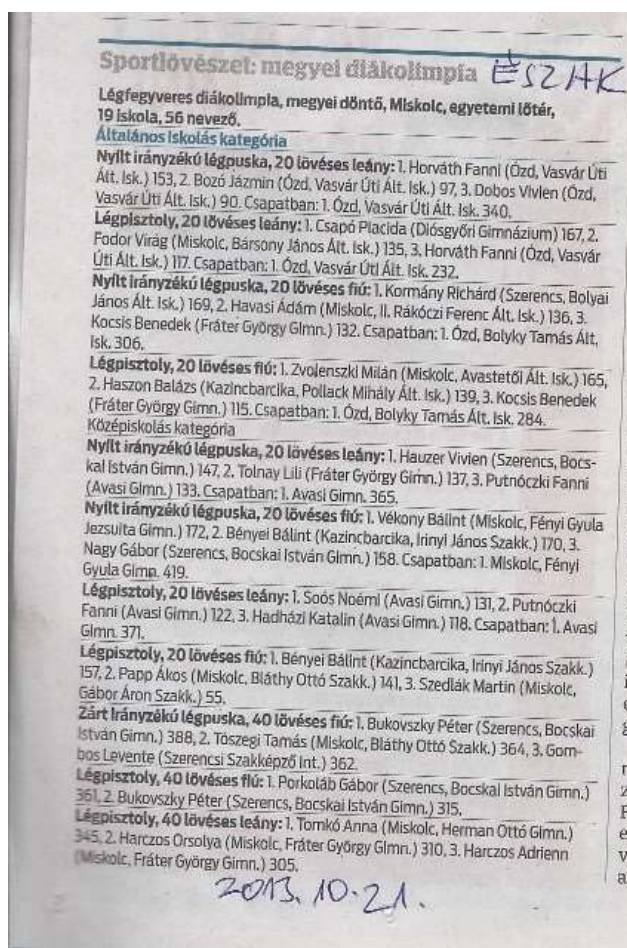
15. sz. kép

Az eredmények az Észak-Magyarország című napilapban is megjelentek.