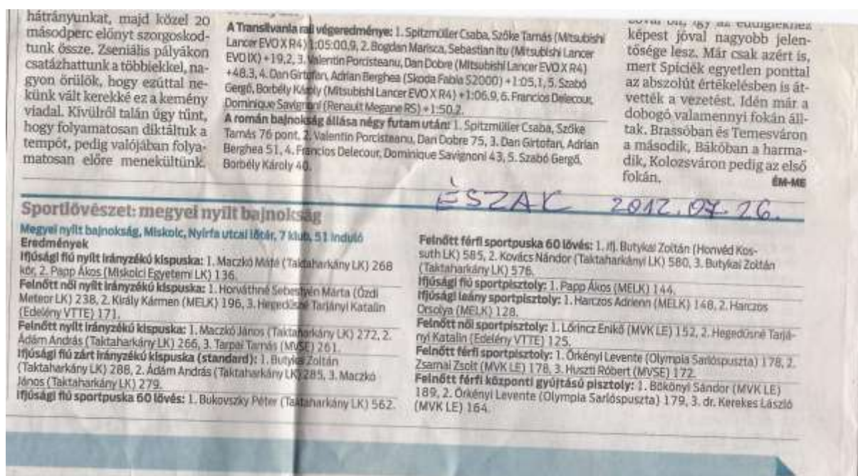
9. sz. kép

A hírről az Észak-Magyarország is beszámolt.