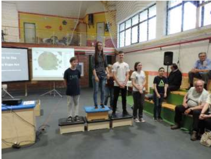
52. sz. kép

A SIUS rendszer egy modern találatjelző rendszer, ezt használják a nemzetközi versenyeken is. Itt a találatot rögtön látják a versenyzők az előttük lévő képernyőn. A verseny az interneten is elérhető volt, így bárhol meg lehetett nézni.