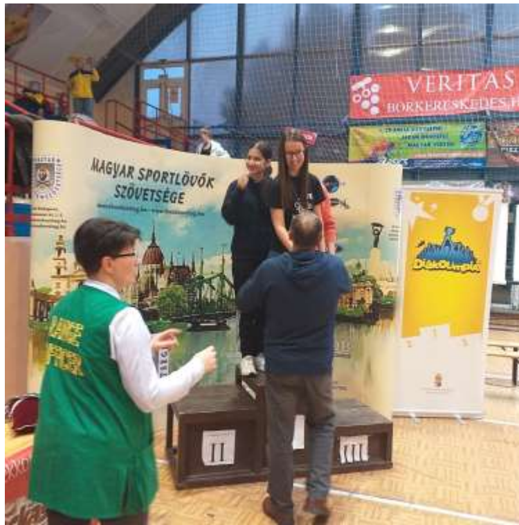
65. sz. kép a SZIKSZI csapat pisztollyal is 1. lett

míg csapatban a SZIKSZI csapata 1. lett.