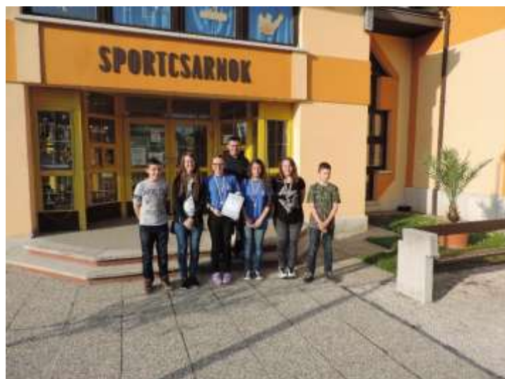
33. sz. kép az ózdi résztvevők csoportja Komáromban

Általános és Középiskolások Országos Bajnoksága Komáromban