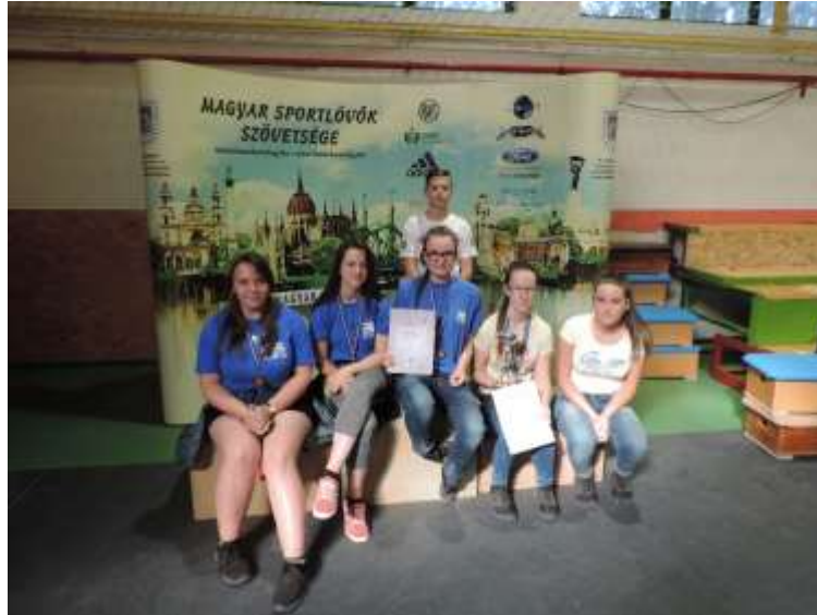
38. sz. kép

Általános és középiskolások országos döntője