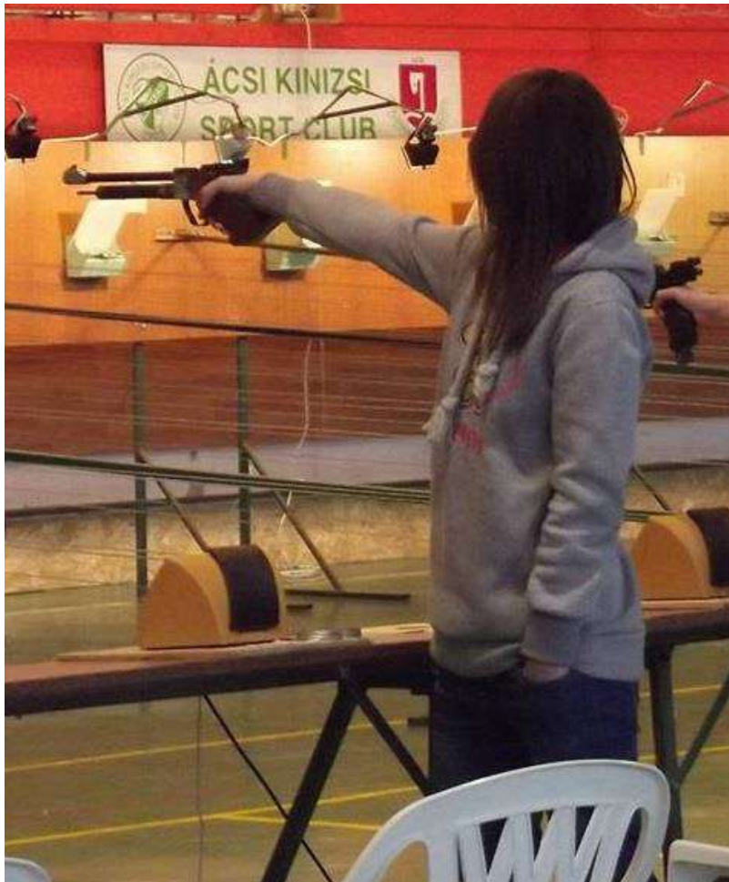
17. sz. kép

Az országos döntőre három ózdi lány is bejutott, így Ők alkották a BAZ megyei válogatottat is légpuskával (itt a megye állíthatott ki csapatot).