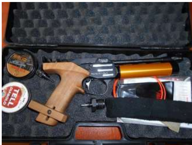
PARDINI légpisztoly (sűrített levegős)