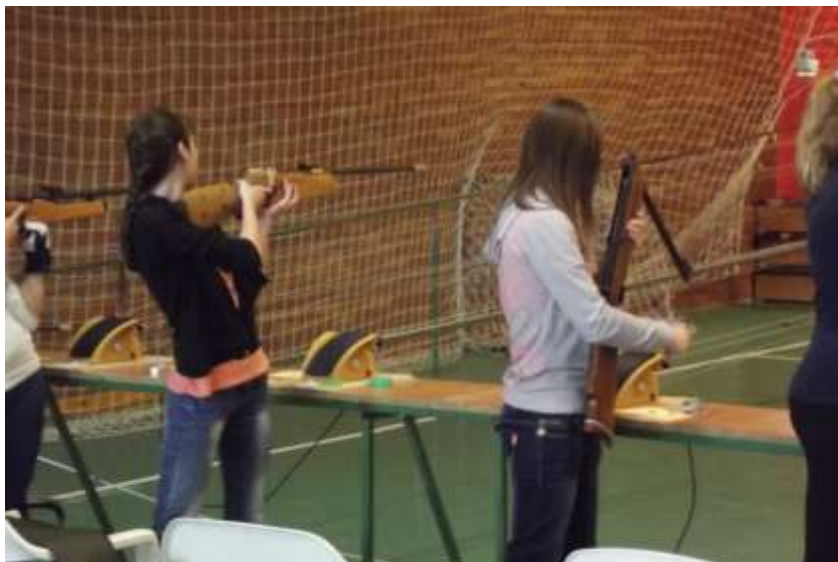
19. sz. kép

lövés közben az ózdi lányok