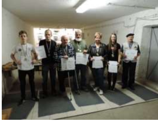
39. sz. kép minden ózdi versenyző éremmel tért haza