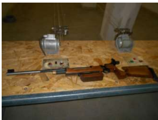
CZ 200 T légpuska