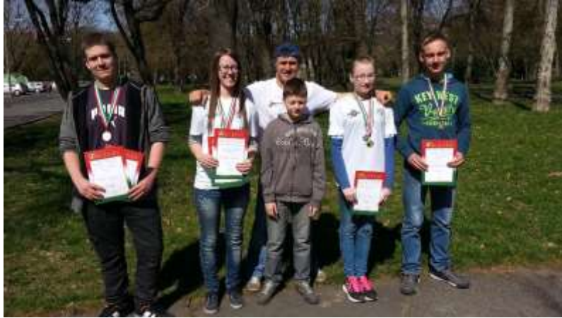
25. sz. kép az általános és középiskolai megyei döntő ózdi résztvevői