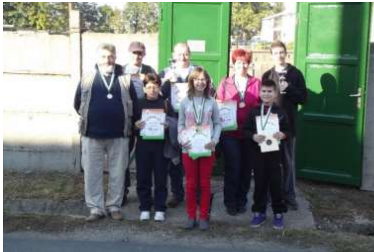
16. sz. kép

Meteor LK - egyesületi összesített pontverseny 2. helyezés.