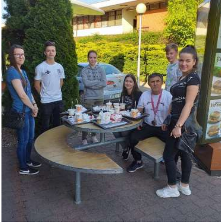
57. sz. kép tájkép ebéd után a versenyzők és edzőjük