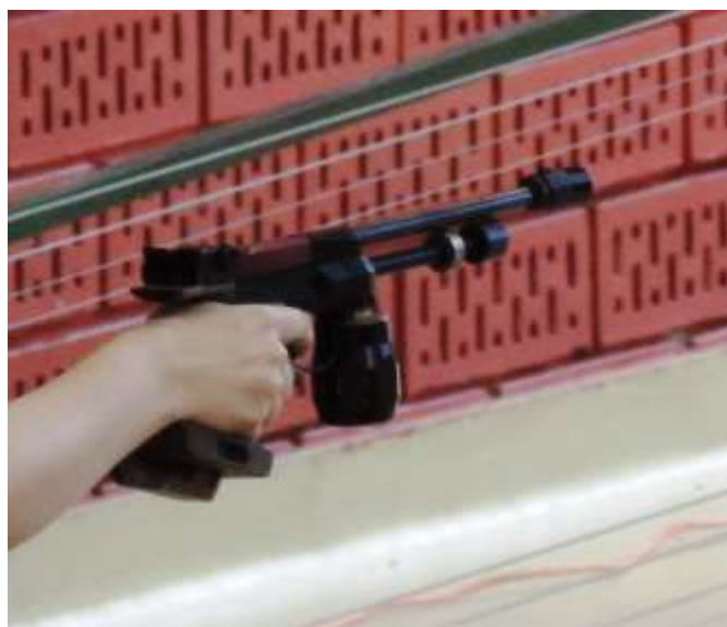
Feinwerkbau légpisztoly (CO 2 -ős)