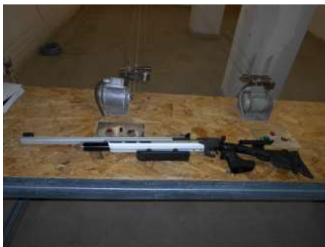
AR 20 Hammerli légpuska