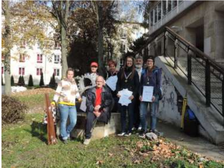
29. sz. kép

a versenyen résztvevő ózdiak csoportja