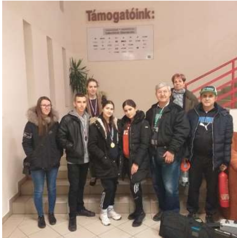
62. sz. kép az ózdi csapat

Diákolimpia országos döntő Székesfehérváron. A csapat ide is leköltözött előtte való napon.