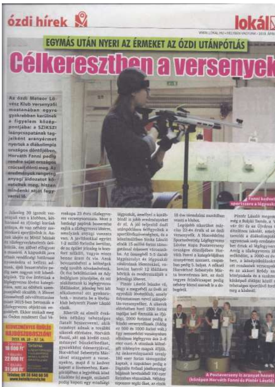
51. sz. kép

Az ózdiak eredményeiről a Lokál nevű lapban is megjelent egy riport.