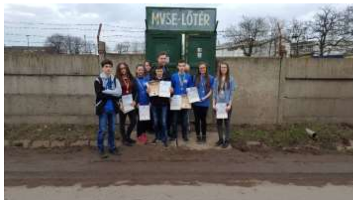
36. sz. kép

Görgey kupa megyei döntő és általános és középiskolások versenyének megyei döntője.