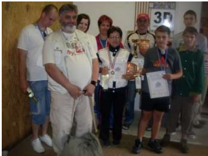
13. sz. kép

a bogácsi versenyen részt vevő Meteor Lövészklub csapata