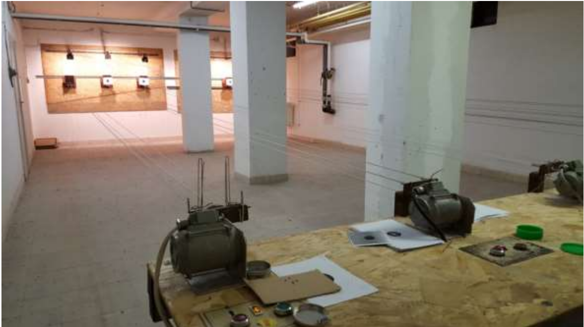
20. sz kép

2014-ben jelentős változás volt a Klub életében, hiszen a Bolyki főúton az Önkormányzat tulajdonában lévő volt Ady kollégium pincéjében lehetőség nyílt egy 6 lőállásos légfegyveres lőtér kialakítására.