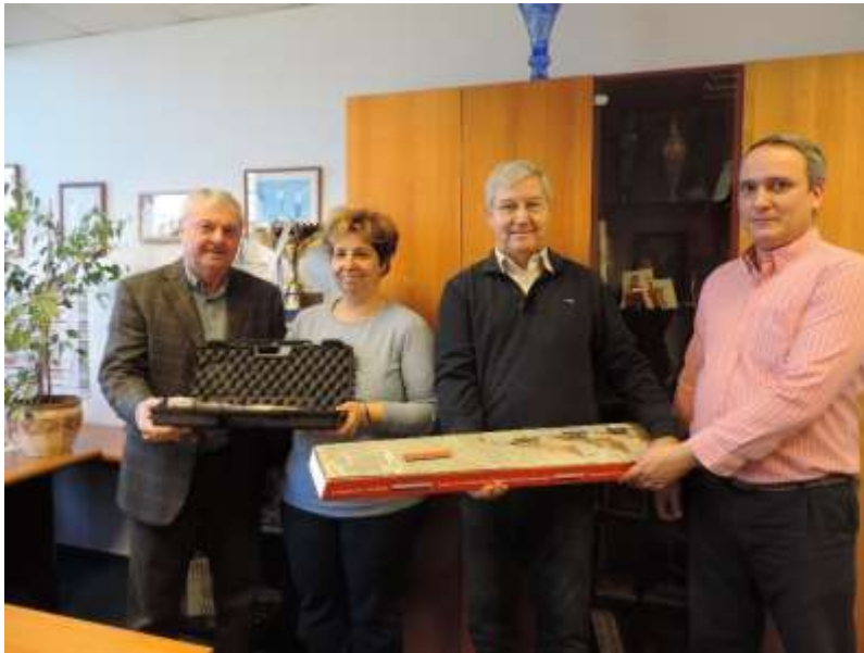
45. sz. kép

utóbbi években elért kiemelkedő eredményeit (utánpótlás nevelés, országos versenyeken elért érmes eredmények) is elismerték.