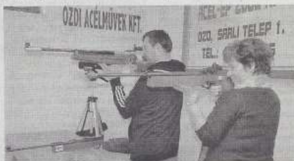
Új lőtermet avattak Ózdon