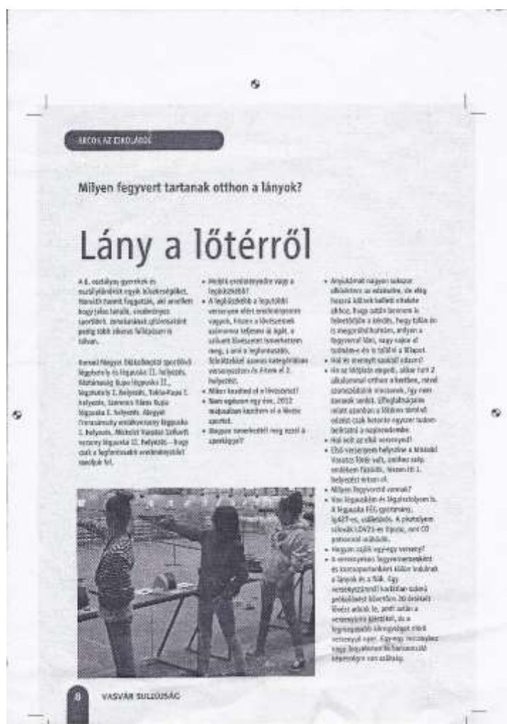
10. sz. kép