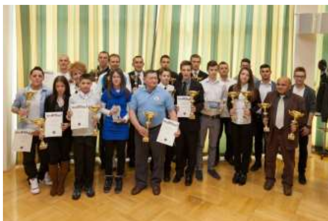
23. sz. kép

Sajnos 2015-re az Önkormányzat által végrehajtott átszervezés miatt (megváltozott a lőfegyveres lőtér tulajdonosa) a lőtér engedélye megszűnt. Így nem volt lehetőség lőfegyveres edzésekre, illetve versenyekre használni. Az engedélyt újra meg kellett volna szerezni, de ez nem történt meg. Ezután már csak a légfegyveres lőteret lehetett használni. Ettől függetlenül a versenyzők részt vettek lőfegyveres versenyeken is, azonban edzésre már nem volt lehetőség.