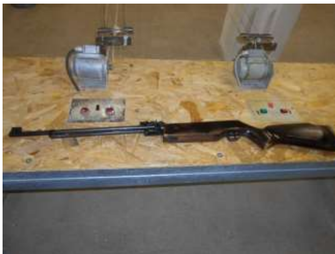
LG 14 légpuska