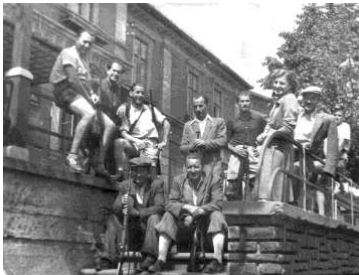
3. sz. kép

A II. világháború után a lövészklub újra szerveződött. Az 50-es évek elején már versenyekre jártak.