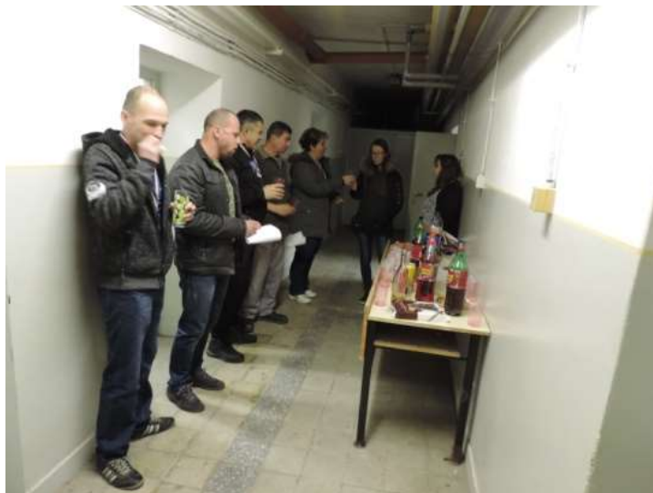
43. sz. kép falatozás a verseny után