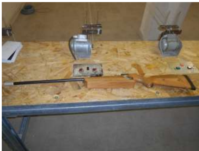
FÉG CLG-62 légpuska