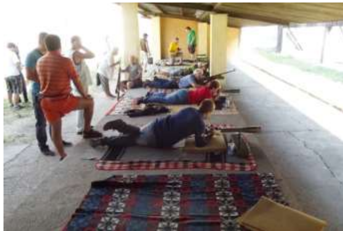
14. sz. kép

lőállásban a versenyzők az Ózd Városi Kupa versenyen