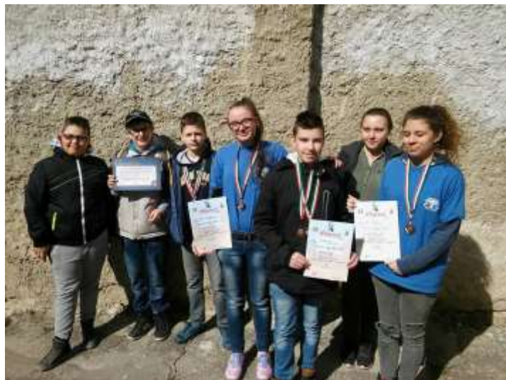
32. sz. kép az ózdi csapat