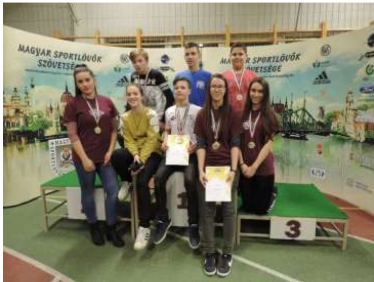
42. sz. kép

az eredményes ózdi versenyzők