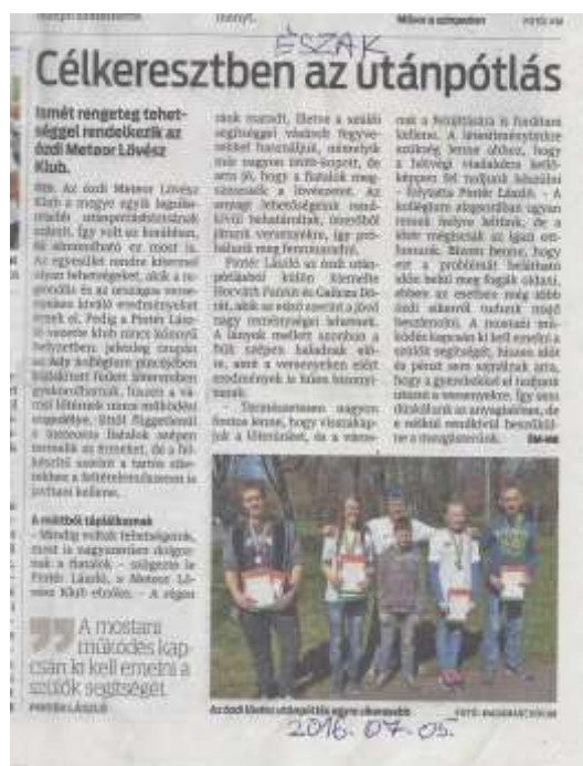
28. sz. kép

Nyáron az Észak Magyarország újságban jelent meg cikk a Meteor Lövészklubról.