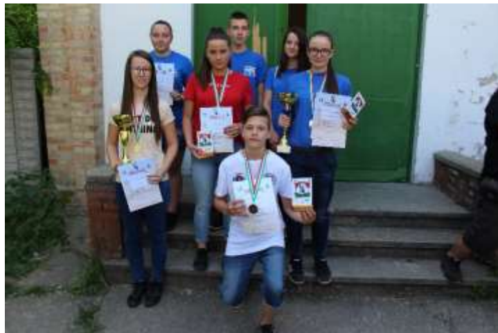
37. sz. kép

az ózdi csapat a Görgey kupa országos döntőjén