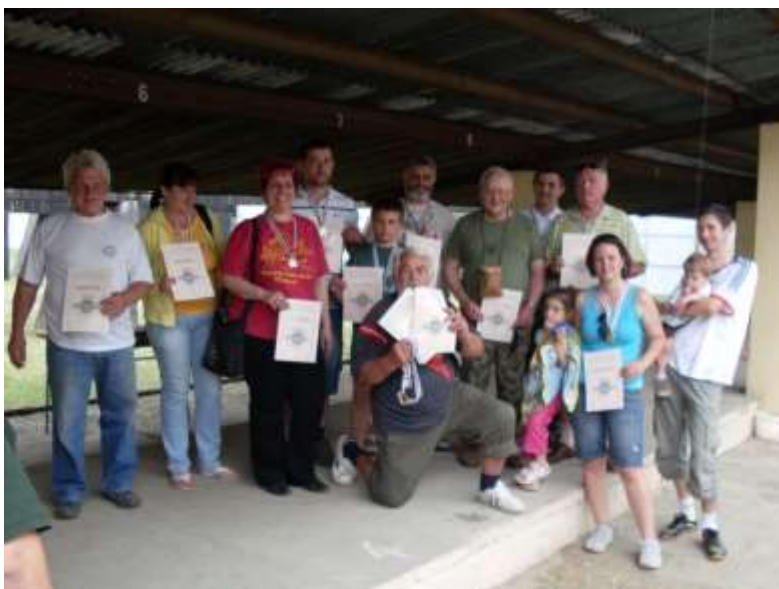
7. sz. kép