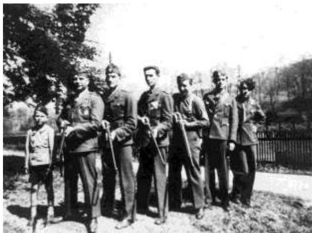
1. sz. kép

A 30-as években komoly szerepe volt a Levente szervezeteknek, hiszen közöttük sok jó lövész volt.