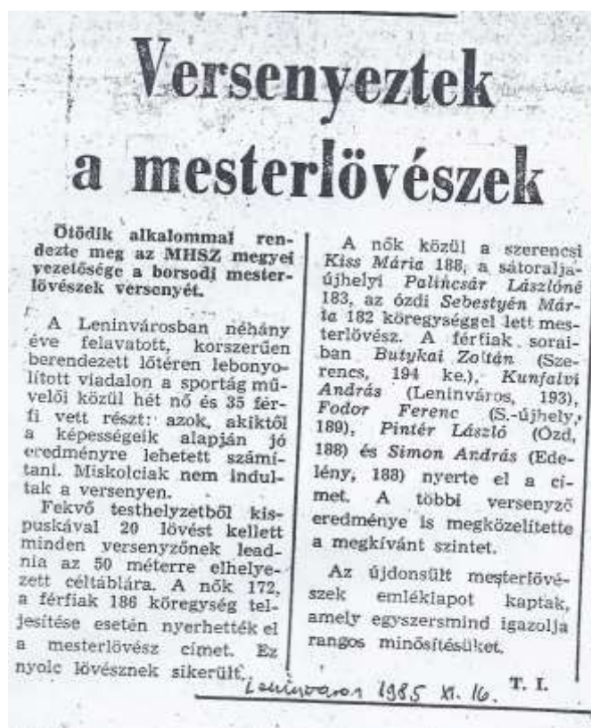
5. sz. kép

Ebben az időszakban Ózdon volt a városnak is és a gyárnak (ÓKÜ) is MHSZ szervezete. Ez a kettősség egészen 1988-89-ig maradt fenn. Ekkor vonták aztán össze a városi és a nagyüzemi MHSZ szervezeteket.