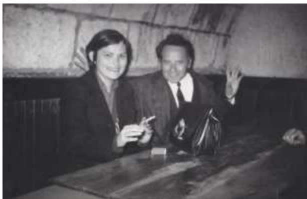
4. sz. kép

Eleinte a Gagarin út (ma Gömöri út) végén volt egy 50 m-es lőtér, ahol az ózdiak gyakorolhattak.